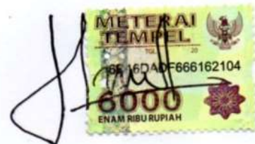
Nur Afni Fitri Fatma Dewi

Semarang, 19 September 2019 Yang menyatakan