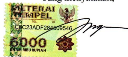
Anggraini Tri Yuniarti