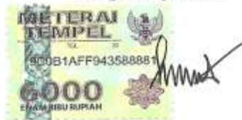
Lathif Nur Mucharam