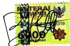
Bagas Dwi Sapto Adhi