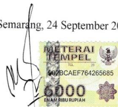
Suryo Atmojo Prakoso