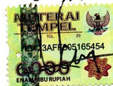
St. Novensius Cahyo Widijatmiko