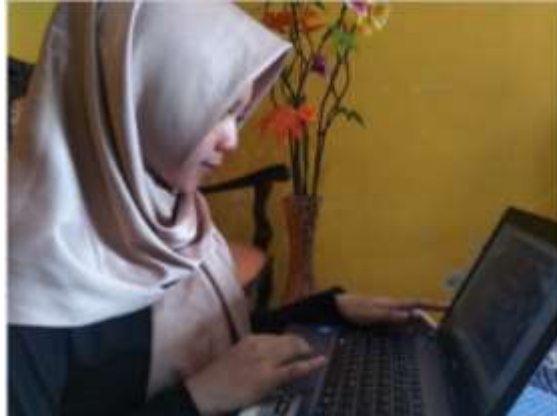
Foto 1 Penelitian yang dilakukan oleh peneliti