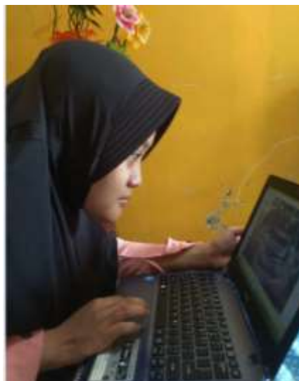
Foto 3 Penelitian interobserver dengan teman