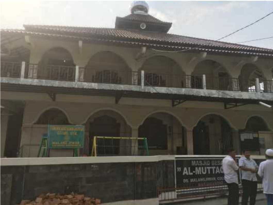
Gambar Foto Halaman Masjid Besar Al MuttaqinMalangjiwan