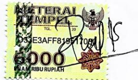
Raras Izki Putri