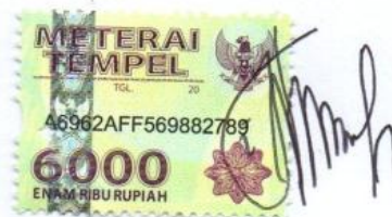
Nur Indah Setyani