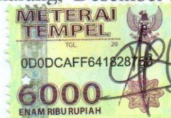
Mega Arum Saputri