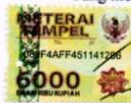
Moch. Asep Rusmana MKNO3X17539

Bandung, Februari 2019 Yang membuat pernyataan,