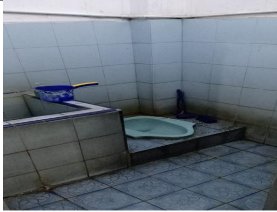
Gambar 13, Foto lantai kamar mandi yang kumuh.