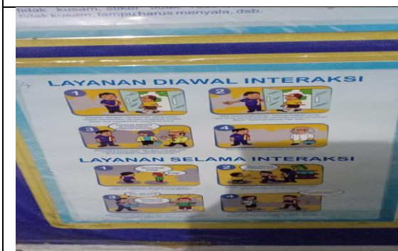
Gambar 11, Foto dokumentasi layanan diawal interaksi.