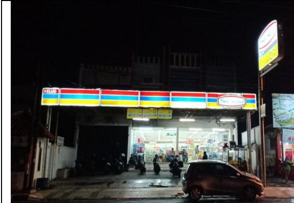
Gambar 1, Foto Indomaret tampak dari depan