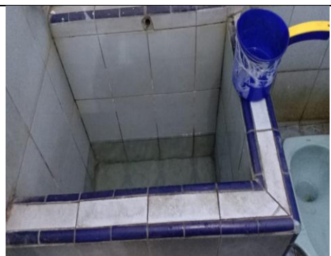
Gambar 6, foto bak kamar mandi