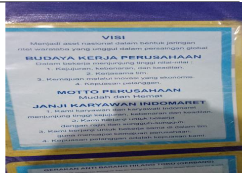
Gambar 8, Foto dokumentasi visi, motto, dan budaya PT. Indomarco Prismatama Cabang Kelud Kota Semarang.