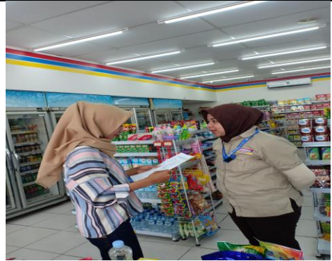
Gambar 2, Foto penulis dengan Supervisor