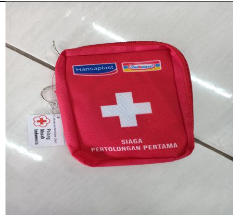
Gambar 10, p3k