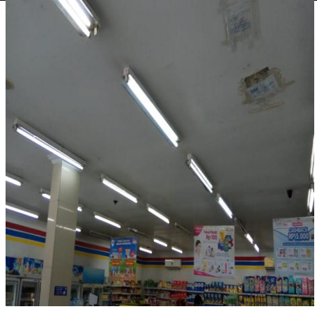
Gambar 14, foto atap Inomaret yang rusak