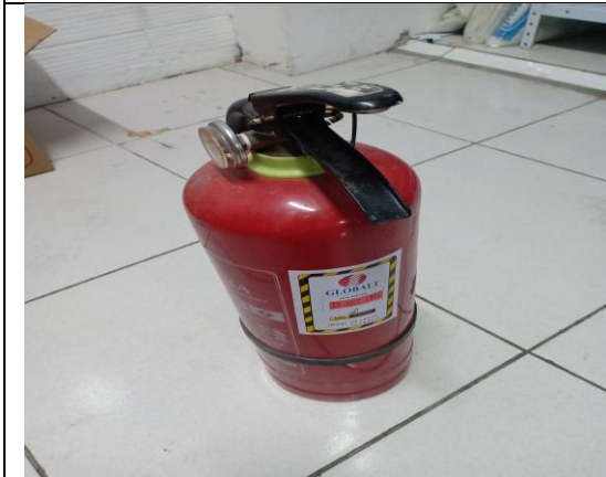
Gambar 9, apar toko