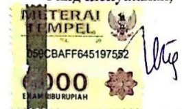
Bening Aulia Larasati