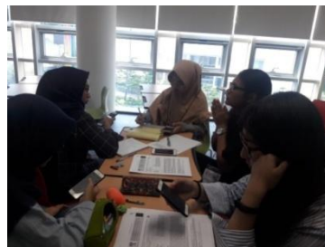
d.5 Sesi diskusi mengenai concepts and case study in Asia di ruang kelas