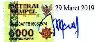
Desy Dian Pratiwi

Adalah benar hasil karya saya dan penuh kesadaran bahwa saya tidak melakukan tindakan plagiasi atau mengambil alih seluruh atau sebagian besar karya tulis orang lain tanpa menyebutkan sumbernya. Jika saya terbukti melakukan tindakan plagiasi, saya bersedia menerima sanksi sesuai dengan aturan yang berlaku.