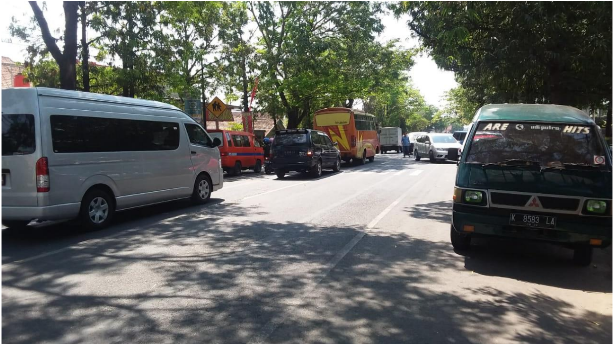
Gambar 3. : Titik Lokasi Penelitian