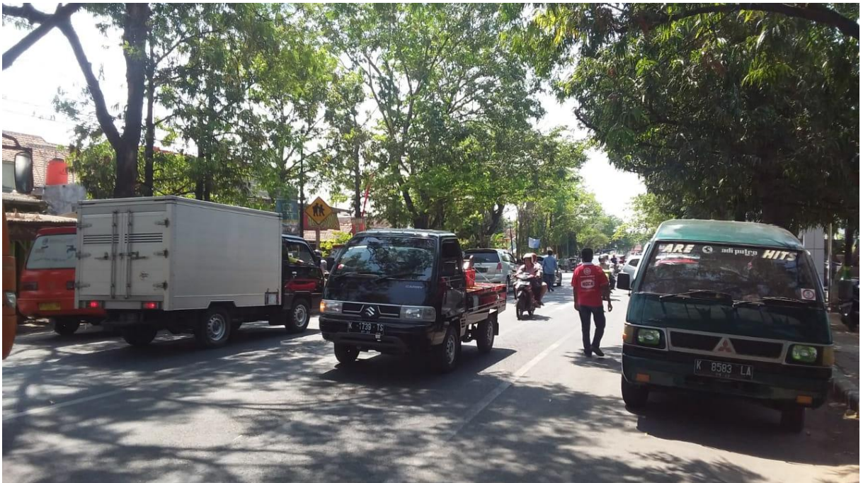
Gambar 6. : Kondisi Hambatan Samping Sumber : Hasil Survei