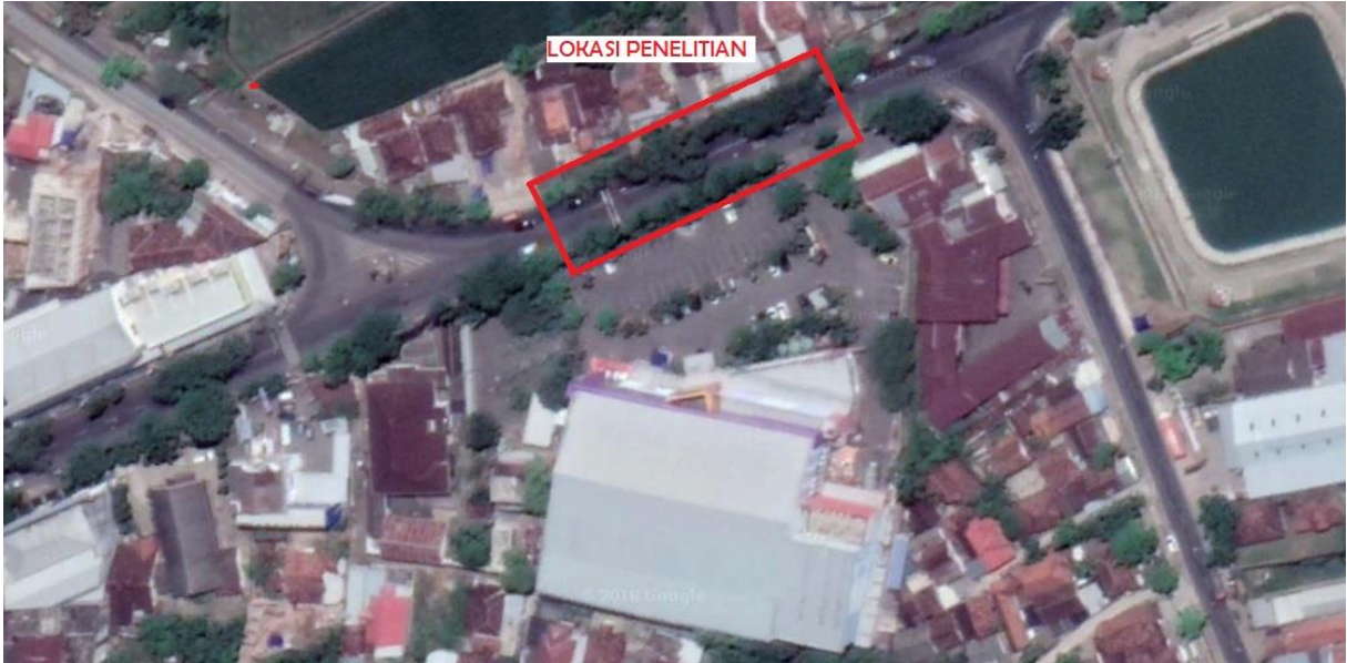
Gambar 1. : Lokasi Penelitian