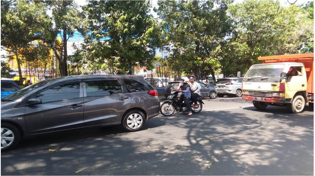
Gambar 5. : Kondisi Arus Lalu Lintas