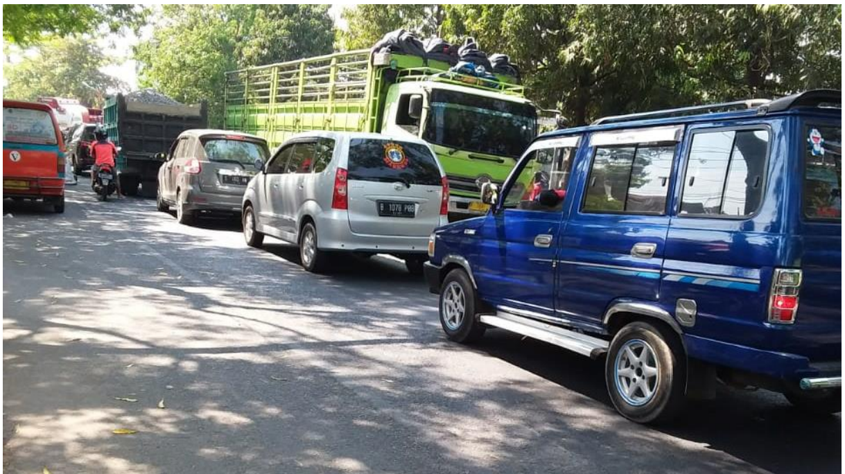
Gambar 4. : Kondisi Lalu Lintas