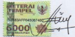
Choerul Imadatil Umah