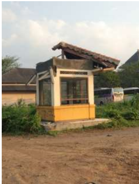
Gambar Pos Retribusi