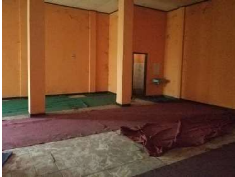
Gambar Ruang Perkantoran