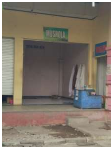
Gambar 4.23 Tempat Ibadah