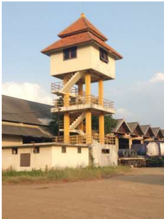
Gambar Ruang Pengawas