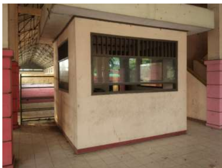
Gambar Ruang Informasi dan Pengaduan