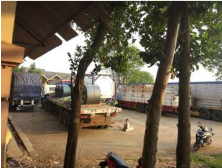
Gambar Ruang Parkir Angkutan Desa