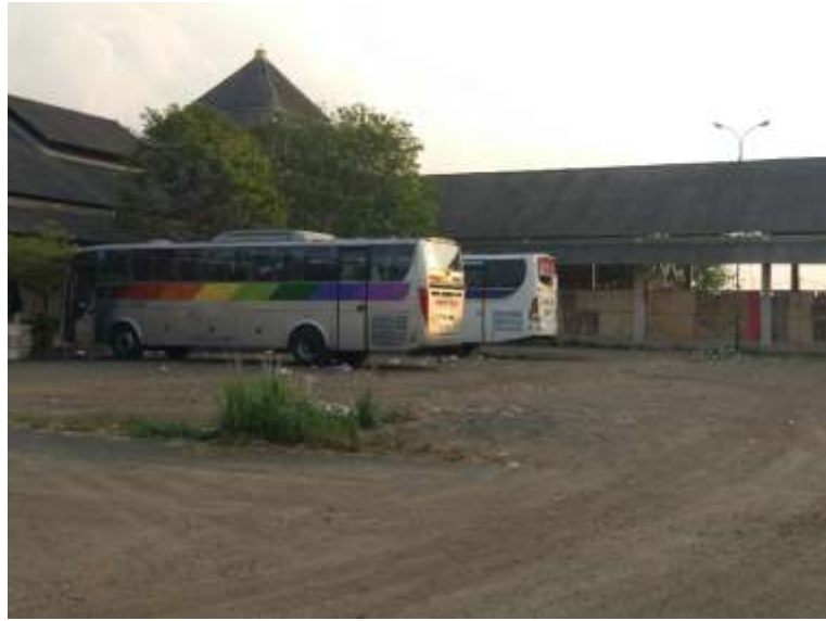
Gambar Parkir AKDP