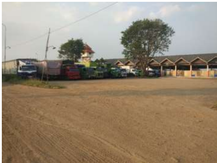
Gambar Ruang Parkir Angkutan kota