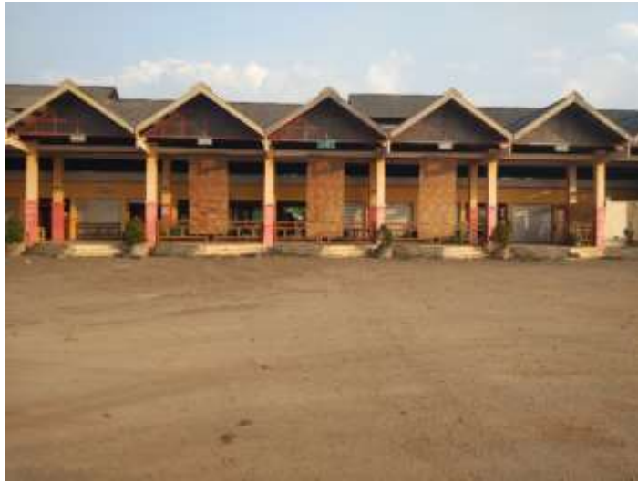
Gambar Ruang Tunggu