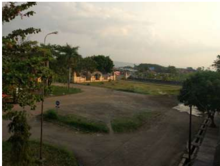
Gambar 4.27 Ruang Luar/Penghijauan