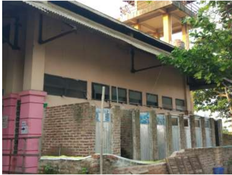
Gambar Kamar mandi