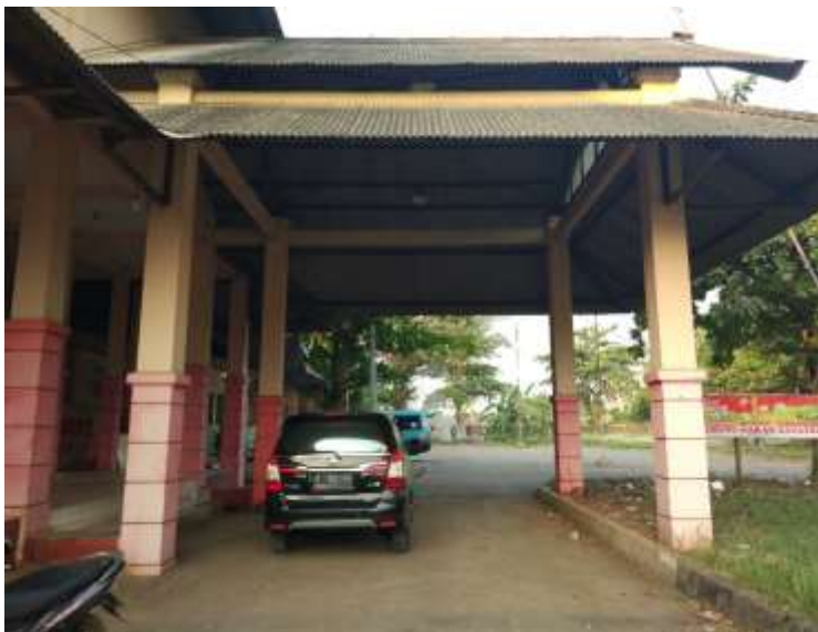
Gambar Ruang Parkir Angkutan Pribadi