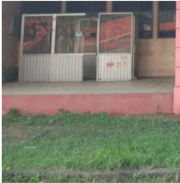
Gambar Telepon Umum