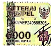
Farah Fauzia Ulfah