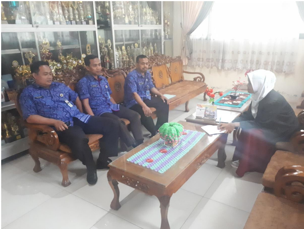
( wawancara dengan pak Sa'dun, pak Muttaqin dan pak Budi)

Pak Muttaqin : sama saja dengan pak Budi dan pak Sa'dun, saya juga mengikuti MGMP PAI di kabupaten Grobogan, selain itu di sekolah ini setiap satu semester ada dua kali rapat internal kepala sekolah dengan tujuan evaluasi dan pengecekan perangkat pembelajaran. Selain itu saya melakukan studi lanjutan.