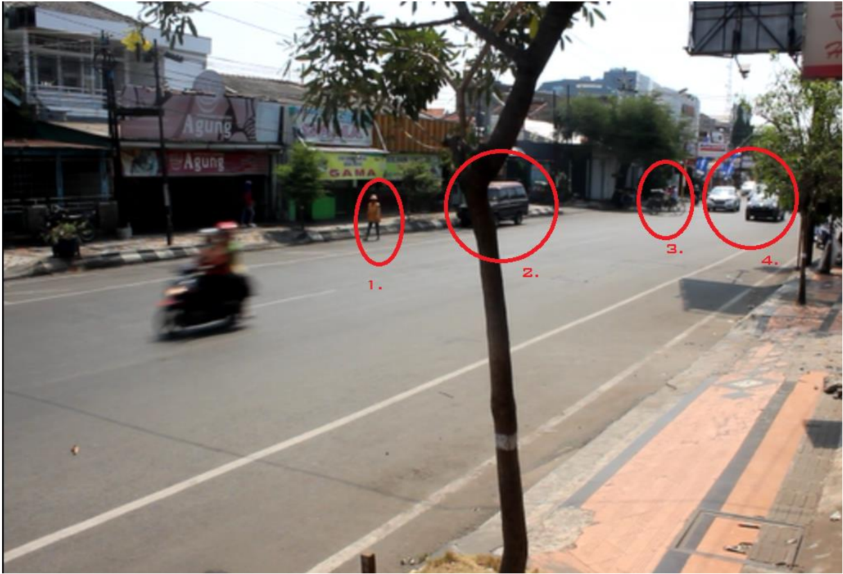
Gambar 2. Hambatan Samping Pukul 11.00 WIB