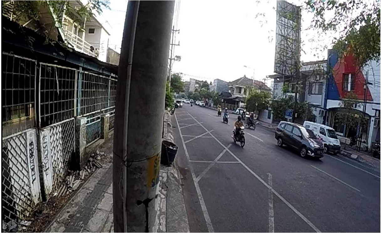
Gambar 3. Kondisi Pagi Pukul 07.00 WIB