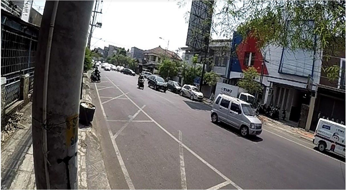
Gambar 4. Kondisi Siang Pukul 11.00 WIB