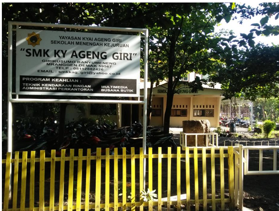
Gedung SMK Ky Ageng Giri