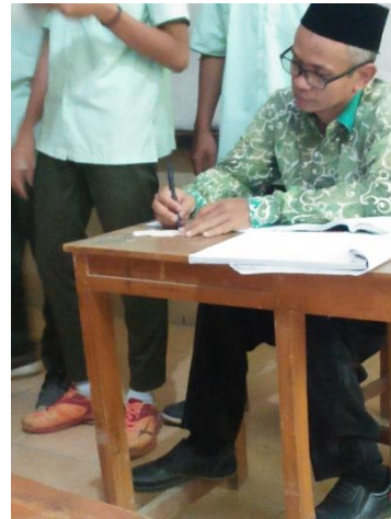
Siswa memberikan kupon untuk berbicara dan nilai guru