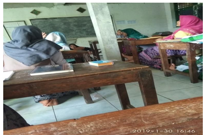
Siswi aktif bertanya