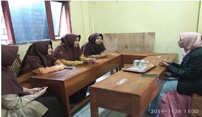
Wawancara dengan anggota ISMAPI