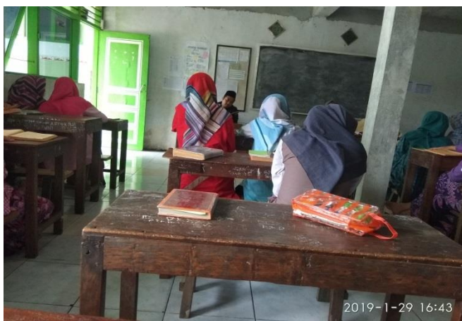
Guru pendamping mengawasi jalannya musyawarah