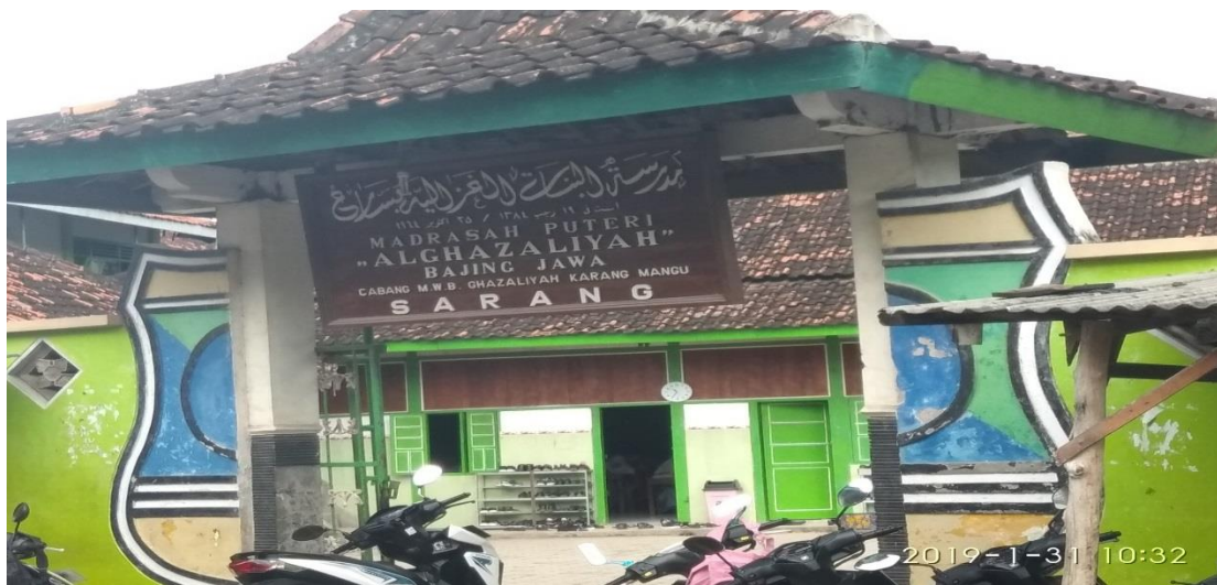
pada Kamis, 31 Januari 2019 Pukul 10.32 WIB.

Tampak bangunan hijau yang terlihat tua, namun sederhana. Di depan saya temui pintu masuk bertuliskan Madrasah Putri Al- Ghazaliyah Bajing Jawa.