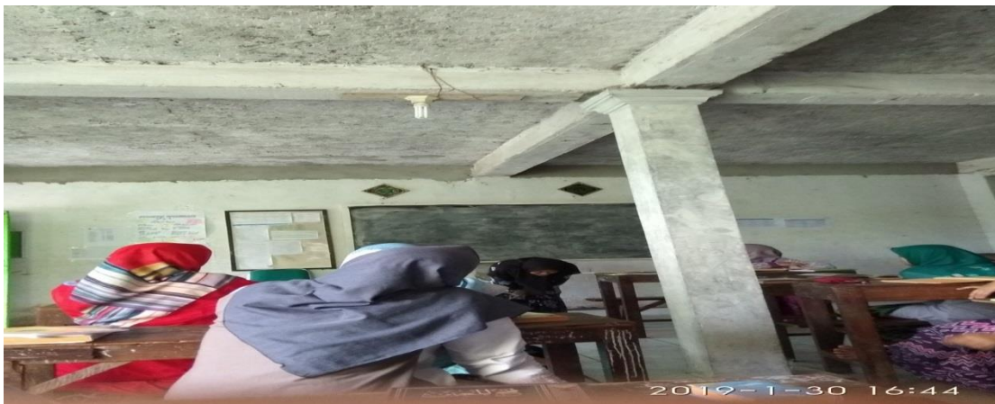
Foto diambil penulis pada hari Rabu, 30 Januari 2019 pada pukul 16.44 WIB ( Siswa sedang mempraktekkan kegiatan salat yang digunakan sebagai bahan musyawarah)

Meskipun begitu, mereka sangat atif dan kreatif sehingga ketika ada musyawirin tidak paham, maka pemateri siap memberikan praktik dari contoh permasalahan. Seperti gambar berikut ini