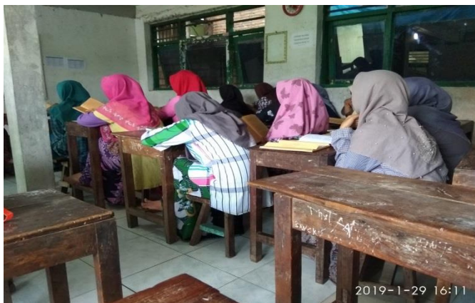
Siswa menyimak Qari'ah saat membaca materi