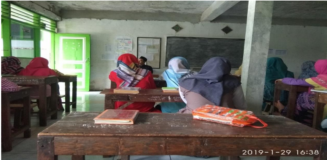
Foto diambil penulis pada hari Selasa, 29 Januari 2019 pada jam 16.38 WIB (Guru pendamping sedang mengawasi jalannya musyawarah).

Beberapa musyawirin mencatat hasil musyawarah dan guru pendamping masih tetap mengawasi jalannya musyawarah sampai akhir.