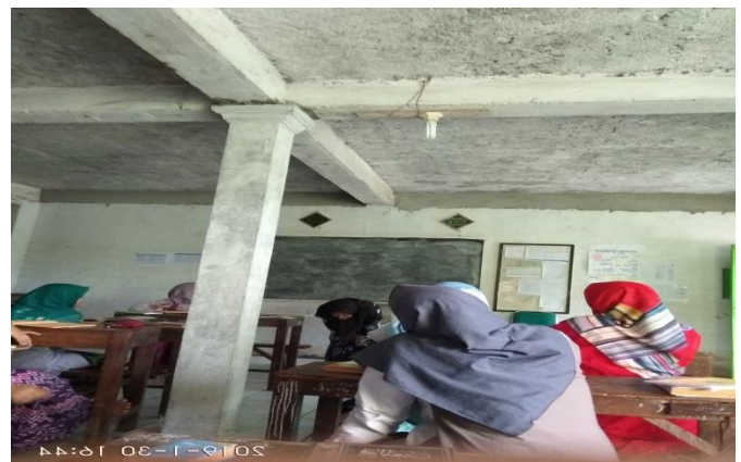
Moderator mempraktekkan pertanyaan dari Sail