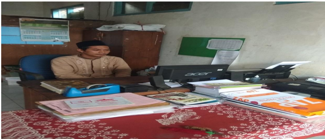
Foto diambil pada hari Sabtu, 2 Februari pukul 9.24 WIB (wawancara guru pendamping).

Setelah beberapa menit saya menunggu di ruang tamu putri, datanglah pak Ulum dengan wajah religinya. Kemudian saya memulai wawancara dan wawancara berlangsung selama 30 menit. Sedangkan transkrip wawancara dapat dilihat pada lampiran hasil wawancara guru pendamping.