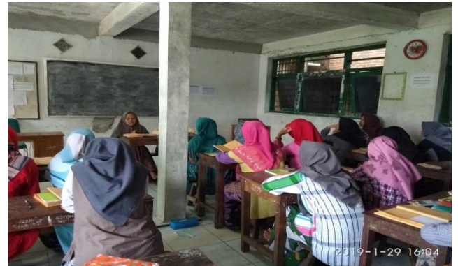
Moderator memimpin musyawarah