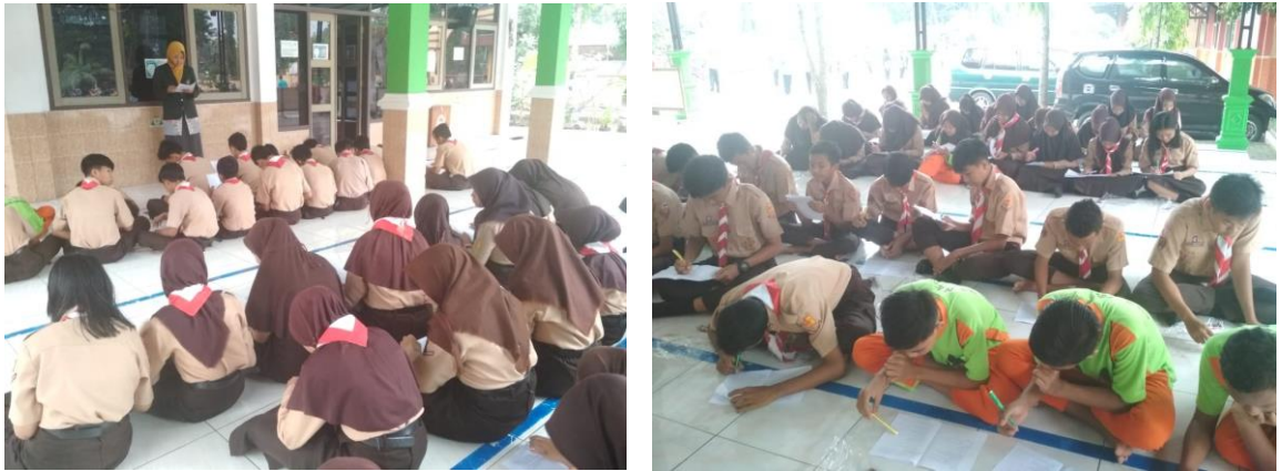
(Pengisian Kuesioner Oleh Peserta Didik Kelas VIII di Serambi Masjid SMP Negeri 34 Semarang)