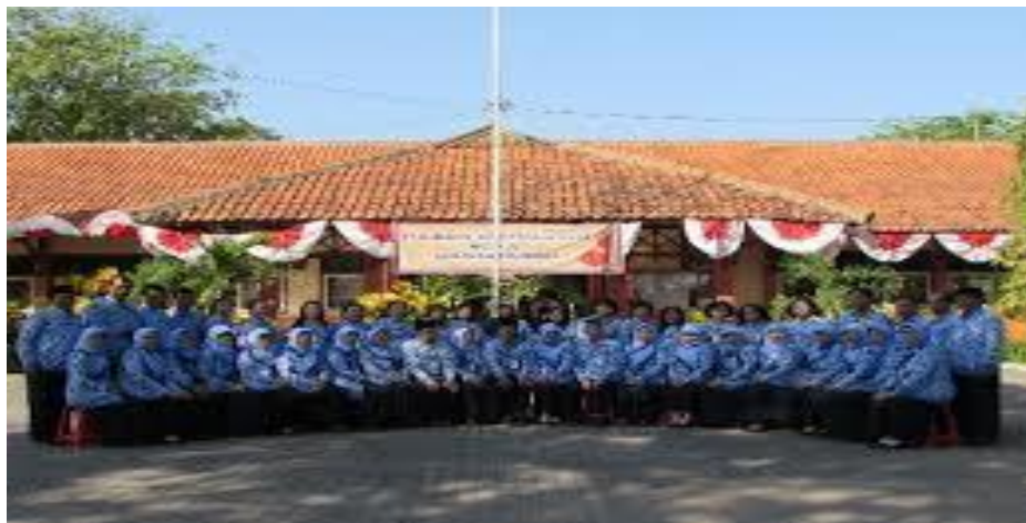
(Guru-Guru SMP Negeri 34 Semarang di Depan Gedung Sekolah)