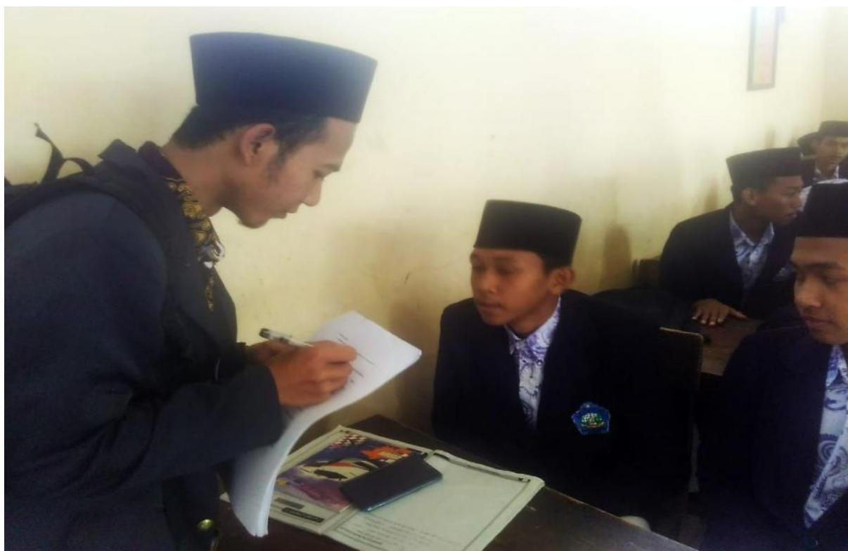
Peneliti melakukan wawancara dengan peserta didik.