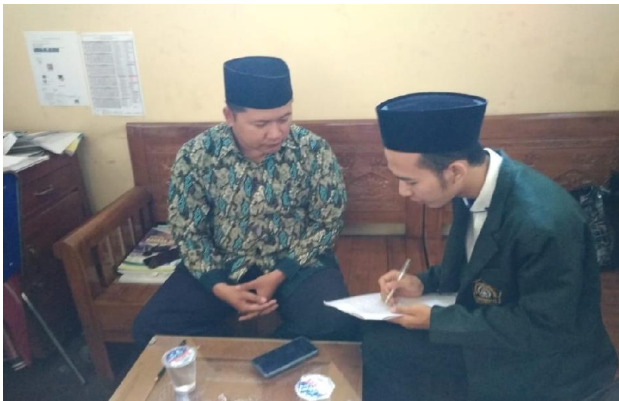
Peneliti melakukan wawancara dengan guru bahasa Arab, 7 februari 2019.