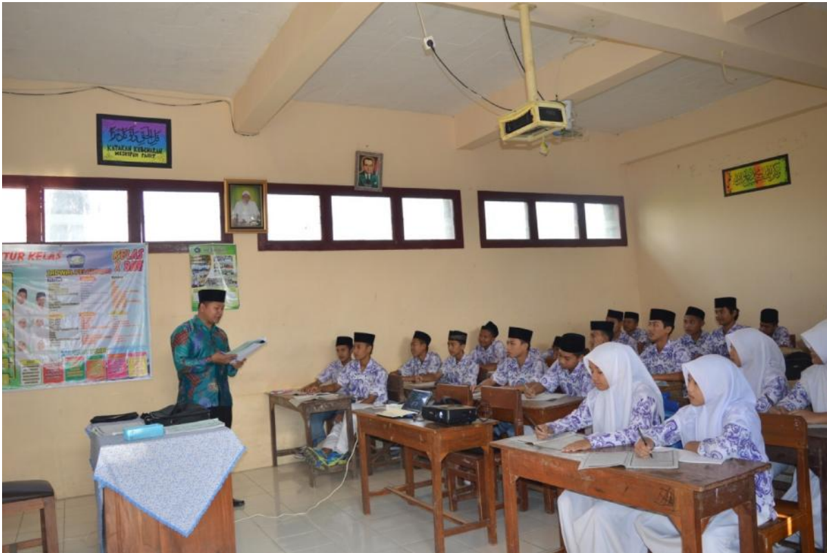
Guru bahasa Arab

mengabsen peserta didik sebelum memulai pelajaran, 4 februari 2019.