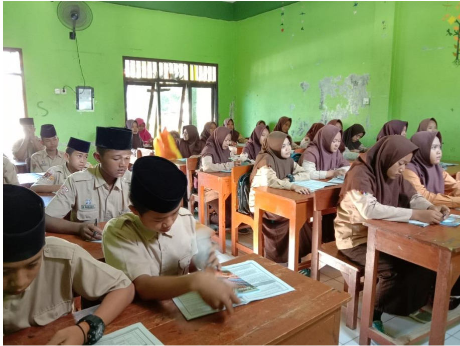
Gambar 3. Keadaan proses pembelajaran