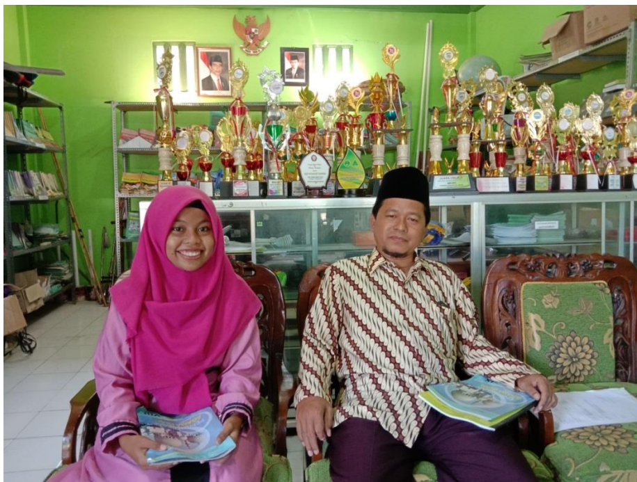
Gambar 4. Wawancara dengan Guru PAI