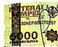
Ratih Fatma Pradita