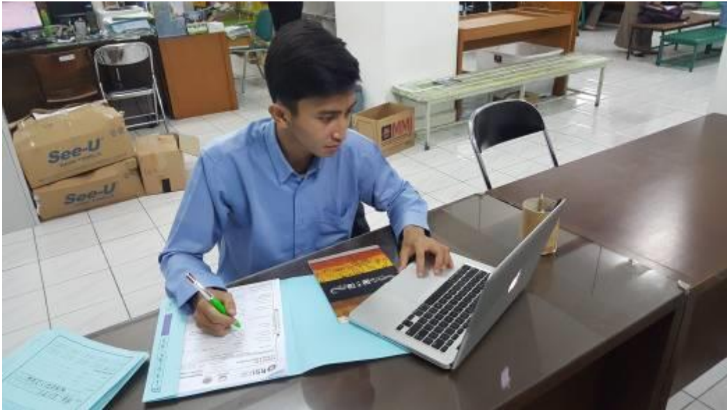
Gambar 1. Pencatatan rekam medis