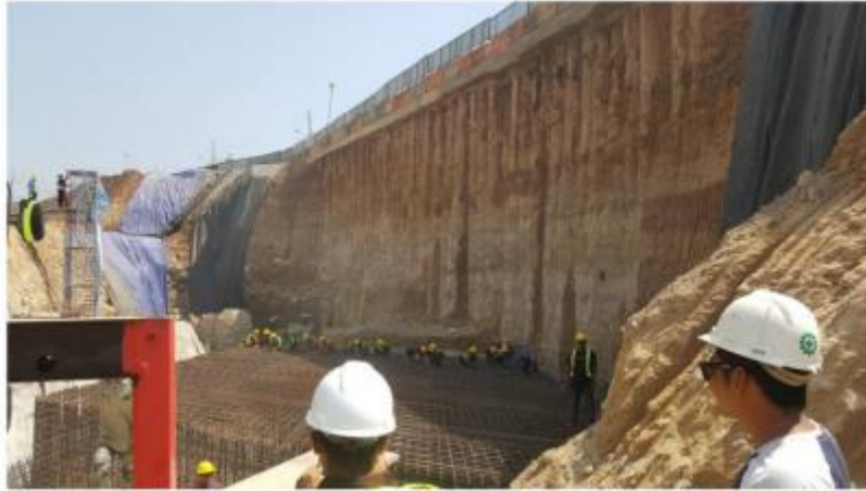
Gambar 7.2 Pemasangan Abutmen