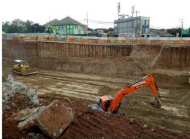
Galian sedalam 10m