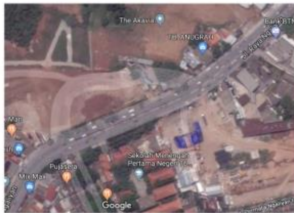
Gambar 7.3 Lokasi pekerjaan