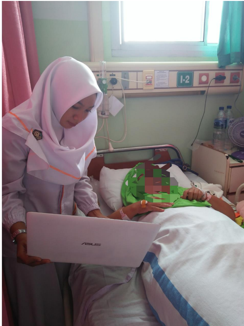
Foto pasien saat melakukan terapi kombinasi warna hijau dan murottal surat Ar Rahman pada pasien post SC