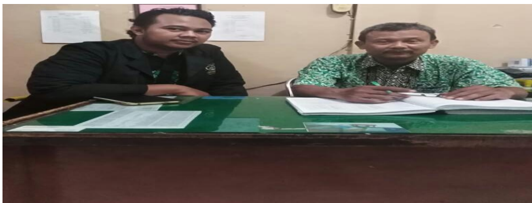
Gambar 3 : Ruang BK