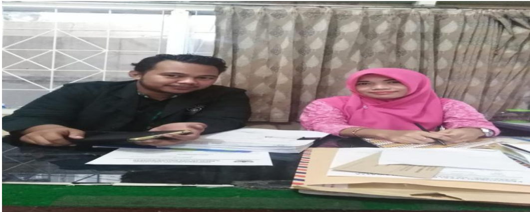
Gambar 2 : Ruang Guru