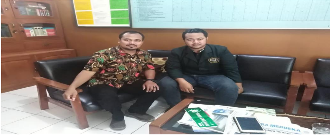
Gambar 1 : Ruang Kepala Sekolah