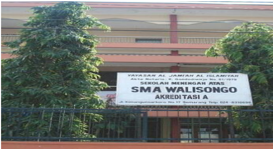
Gambar 5 : SMA Walisongo Semarang