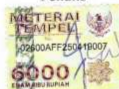
Rahil Rita Unike