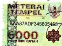
Zakiyyah Qurrotul 'Aini