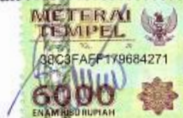
Intan Dwi Irawati