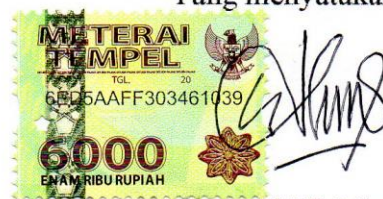
Noni Tuhlifi Miadani

Semarang, 03 Oktober 2018 Yang menyatakan,