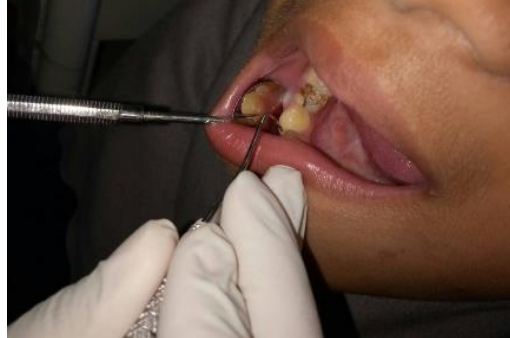
Pemeriksaan Indeks Gingiva