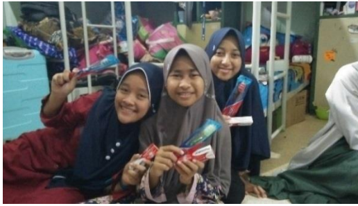
Setelah Pemeriksaan dan Pengisian Kuisisioner