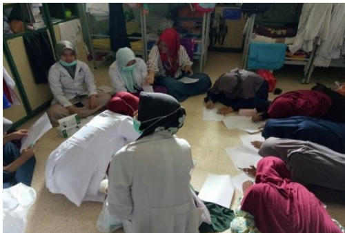
Pengarahan dan pengisian Kuisisioner di Asrama santri