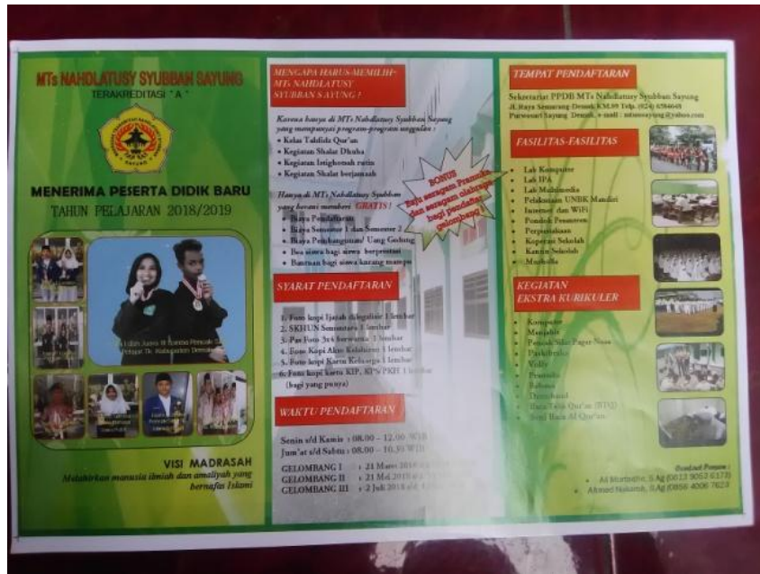
Gambar 11. Brosur Madrasah