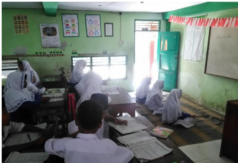
Gambar 14. Suasana Penilaian Unjuk Kerja Aspek Keterampilan