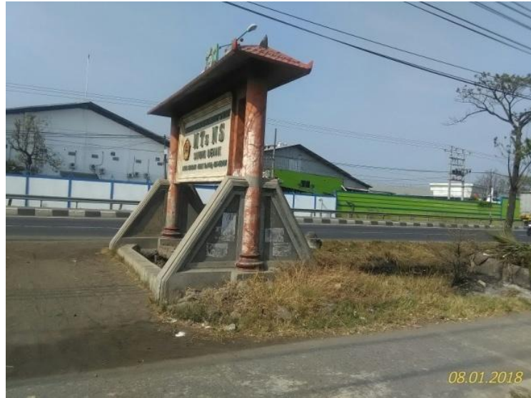
Gambar 2. Papan Pengenal Madrasah