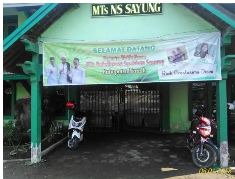
Gambar 1. Bagunan Madrasah dari Depan