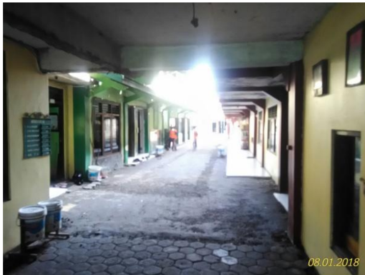
Gambar 3. Suasana Halaman Depan Ruang Kelas