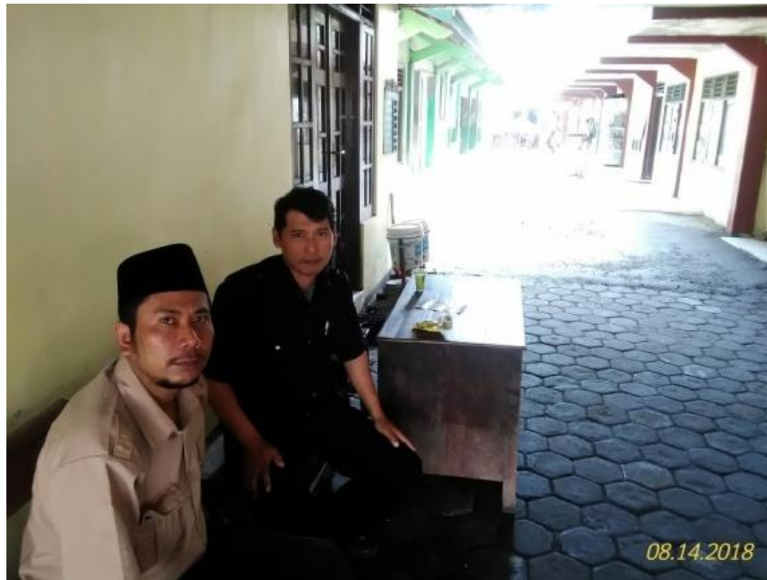
Gambar 9. Foto Guru dan Penjaga Madrasah