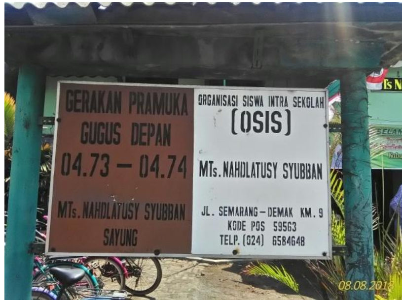
Gambar 5. Papan Pengenal Madrasah