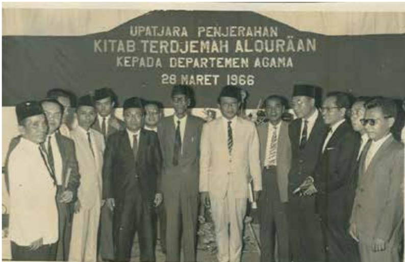
Sebagai Menteri Agama mendirikan Lembaga Penerjemah al-Qur'an yang antara 1962-1966 berhasil menerjemahkan al-Qur'an sebanyak 30 juz.