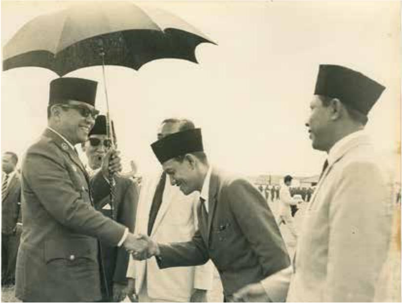
Prof. K.H. Saifuddin Zuhri (kanan) menyambut kedatangan Presiden RI, Ir. Soekarno (berpayung) pada acara pembukaan Mukhtamar Partai NU ke-23 di Solo, 25-29 Desember 1962.