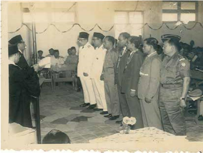
Meresmikan Fakultas Tarbiyah IAIN Darussalam DI Aceh (1962)