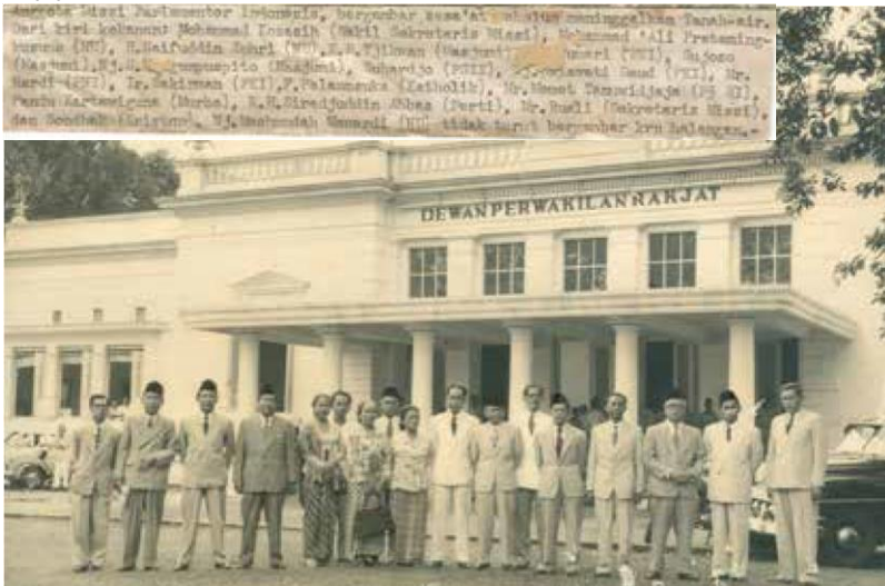
Prof. KH. Saifuddin Zuhri (ketiga dari kiri) bersama anggota Misi Parlemen Indonesia sebelum berangkat melakukan kunjungan ke berbagai negara Uni Sovyet dan Eropa Tengah, berpose bersama di depan Gedung DPR RI (1956).

negara-negara yang baru merdeka dan membebaskan negara yang masih terjajah. (1965).