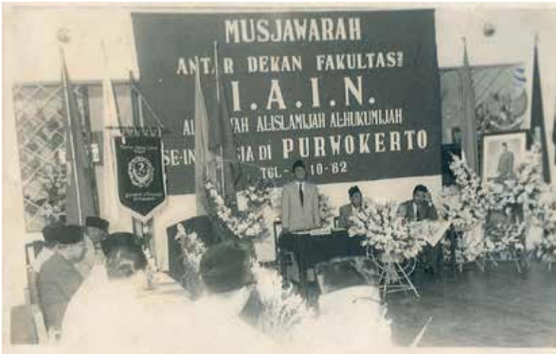
Meresmikan berdirinya Sekolah Persiapan IAIN Purwokerto (1962) Sebagai Menteri Agama menyampaikan pengarahannya pada Musyawarah Antar Dekan Fakultas-Fakultas IAIN seluruh Indonesia di Purwokerto (1962)