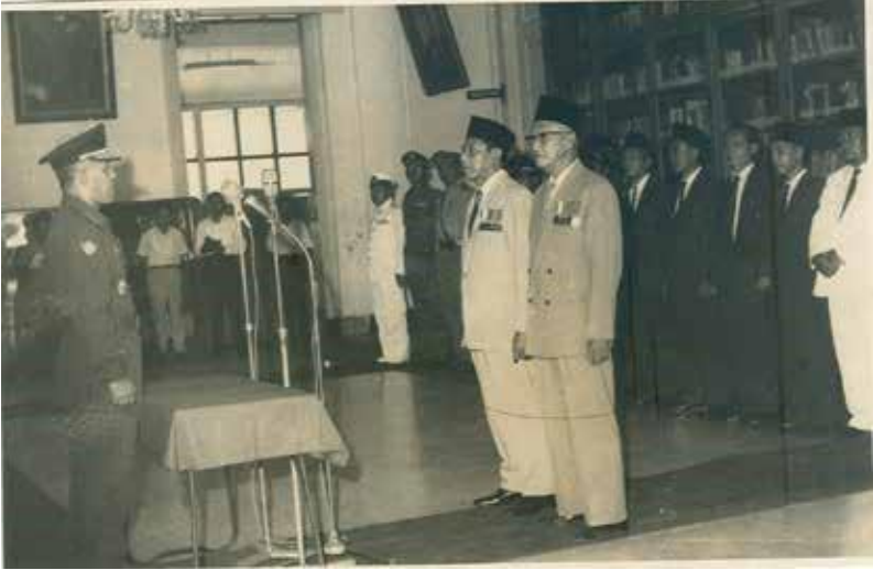
Prof. KH. Saifuddin Zuhri (tengah) menerima Tanda Kehormatan berupa Satyalancana Peristiwa Perang Kemerdekaan Ke satu dan Satyalancana Peristiwa Perang Kemerdekaan Kedua, disampaikan oleh Menteri Koordinator Pertahanan dan Keamanan Jenderal A.H. Nasution (kiri) pada 4 November 1964.