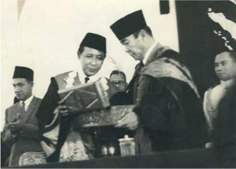
Menjadi promotor dalam pemberian gelar Doktor Honoris Causa bidang Dakwah kepada Ir. Soekarno (1964)