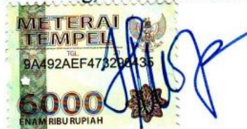
Nur Azizah Jamal