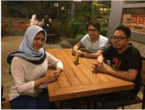
Foto bersama ketua Komnitas Rumah Pelangi Indonesia Kota Semarang