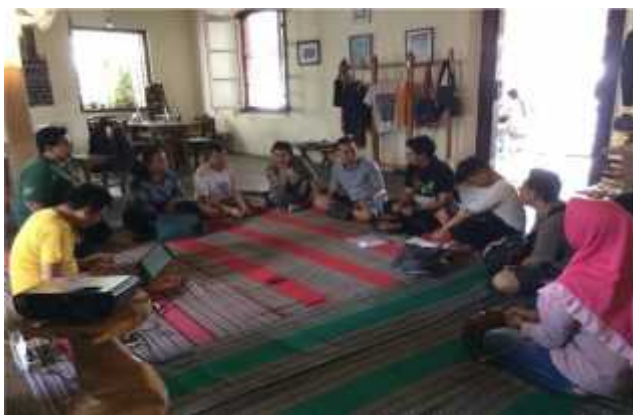
Mengikuti Focus Group Discussion tentang SOGIESC