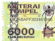
RIZAL NUR PRADANA