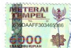
Achmad Danang Setiaaji

Semarang, 03 Oktober 2018 Yang Menyatakan,