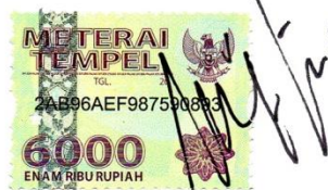
Liftia Layyinatius Syifa'